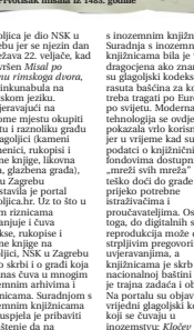
Prostorni nacrt iz 1482. godine

Urednik i odgovorni timovi sredstva otvorena pod pokroviteljstvom predsjednice Republike Hrvatske kolodnja Gradar Kitarović, Udruga RH. Hrvatska knjižnica i Grada Zagreba, Udruga RH. Hrvatska knjižnica i Grada Zagreba, Udruga RH. Hrvatska knjižnica i Grada Zagreba, Udruga RH.