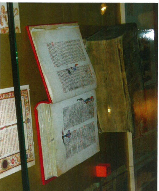
Hrvoslov misal je glagoljski iluminirani rukopis pisan za velikog vojvodu Hrvolja Vukčića Hrvatinića između 1403. i 1404. godine