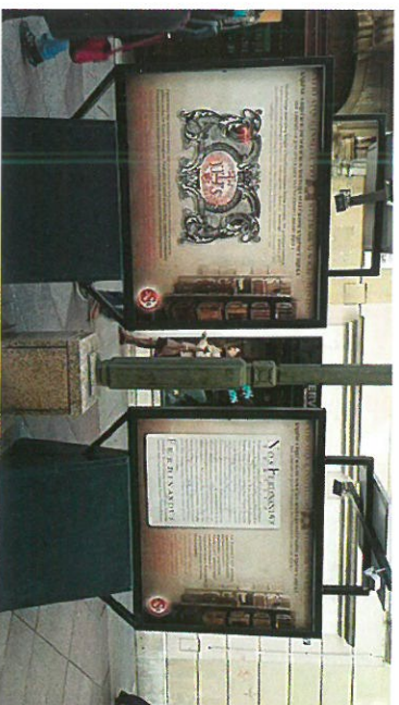
Izložba plakata na Korzu