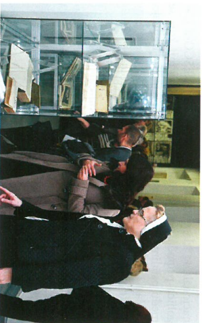
Uzvanici u razgledu izložbe knjiga isusovačkoga kolegija