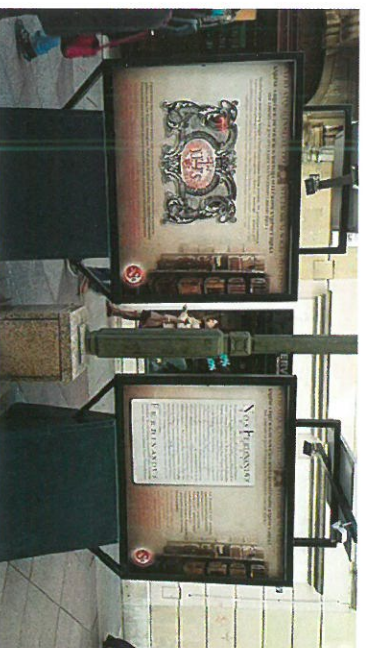
Izložba plakata na Korzu