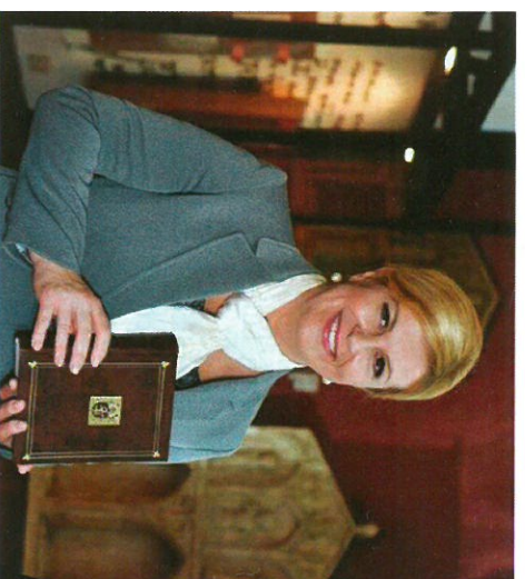
Predsjednica RH Kolinda Grabar Kitarović s prigodnim poklonom – pretiškom glagoljskog misala iz riječke glagoljske tiskare Šimuna Kožičića Benje

Osim knjiga iz isusovačke zbirke mogla se vidjeti i originalna povelja tadašnjega vladara, cara Ferdinanda II., ko-