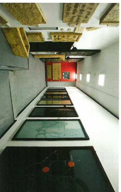
Prostor izložbe Glagoljica s Bašćanskom pločom

– »Mi to moramo dokazati međunarodnoj zajednici kako bi nam Istra konačno i pravno pripala«, raspricao se Mezulić, dodavši kako namjerava napisati i knjigu o fašističkim zločinima.