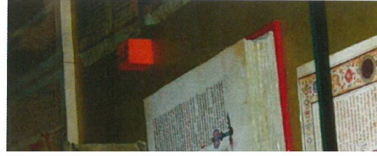
an za velikog vojvodu godine

veučilišnoj knjižnici rafska obrada isuso- adeno 620 svezaka.