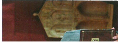
rič s prigodnim misalima iz riječke

Glagoljicu, to nacionalno hrvatsko pismo, krunski dokaz slavenstva na ovim prostorima, nije se smjelo ni spominjati: