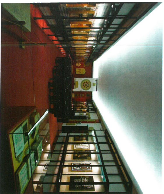
Dvorana izložbe Glagojlica

U drugoj polovici 2016. godine u Sveučilišnoj knjižnici započela je sustavna i cjelovita bibliografska obrada isusovačkog fonda, od čega je do danas obrađeno 620 svezaka.