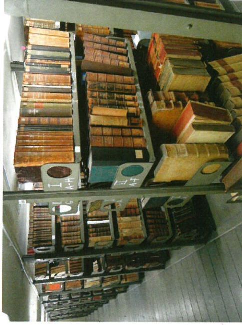
Knjige isusovačkoga kolegija – današnji smještaj u Sveučilišnoj knjižnici

Hrvatske isusovačke knjižnice uglavnom nisu bibliografski obrađene i uključene u internetske baze podataka, pa informacija o njihovoj sadržaju nije dostupna ni općoj javnosti ni istraživačima. Posljedica toga je nedovoljno poznavanje bogatstva hrvatske baštine i hrvatske povijesti kod njenih građana, ali i na međunarodnom planu, gdje hrvatska kultura zaslužuje mnogo bolje poziciju.