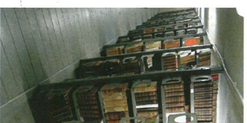
Knjige isusovačkoga koleg

Hrvatske isusovačke k obradene i uključene formacija o njihovu sastu ni istraživačima. P vanje bogatstva hrvat njenih građana, ali i n ska kultura zaslužuje i Profesor dr. sc. Ir ku Filozofskog fakult na, povodom 370. ob nja Družbe Isusove u u Rijeci objavio iznim sadržaj jednoga cjelo du isusovačke knjižni tallogo della Bibliothec Članak sadrži i prijet bljeskama.