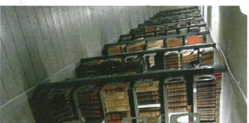
Knjige isusovačkoga koleg

Hrvatske isusovačke k obradene i uključene formacija o njihovu sastitu ni istraživačima. P vanje bogatstva hrvat njenih građana, ali i n ska kultura zasluguje i Profesor dr. sc. Ir ku Filozofskog fakult na, povodom 370. ob nja Družbe Isusove u u Rijeci objavio iznim sadržaj jednoga cjelo du isusovačke knjižni tallogo della Bibliothec Članak sadrži i prijet bljeskama.