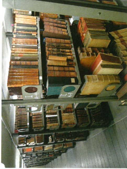
Knjige isusovačkoga kolegija – današnji smještaj u Sveučilišnoj knjižnici

Hrvatske isusovačke knjižnice uglavnom nisu bibliografski obrađene i uključene u internetske baze podataka, pa informacija o njihovoj sadržaju nije dostupna ni općoj javnosti ni istraživačima. Posljedica toga je nedovoljno poznavanje bogatstva hrvatske baštine i hrvatske povijesti kod njenih građana, ali i na međunarodnom planu, gdje hrvatska kultura zaslužuje mnogo bolje poziciju.