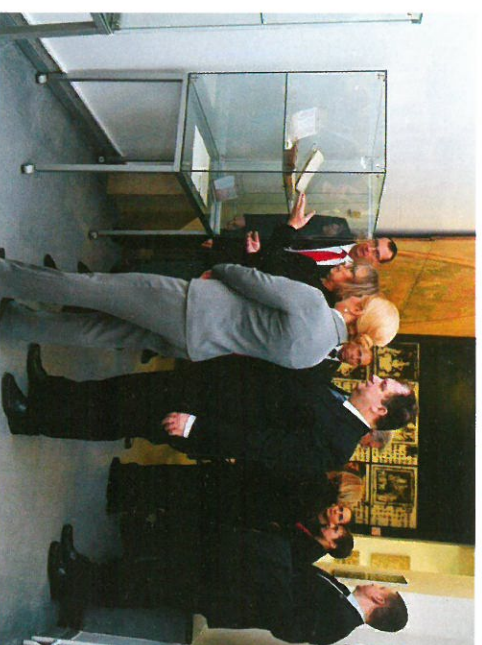
Predsjednica RH Kolinda Grabar Kitarović sa suprugom razgleda izložbu knjiga iz isusovačke knjižnice

prideđivanje svečanosti na samu obječnicu 23. studenoga i priređivanje izložbe primjeraka iz fonda riječke isusovačke knjižnice u tri inačice (fizička izložba knjiga, izložba na webu knjižnice i izložba plakata na Korzu).